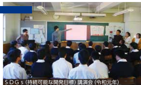
SDGs (持続可能な開発目標) 講演会 (令和元年)

毎年、1学年生徒全員を対象に参加型の国際交流イベントや講演会を実施しています。一人ひとりが国際社会の課題と向き合います。