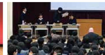
R元年度ウィンターカップ決勝の様子