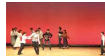
R元年度英語劇コンテスト上演の様子

蕨高生は外部のコンテストでも大活躍しています。外国語科の生徒だけでなく、普通科の生徒も参加し、活躍しています。